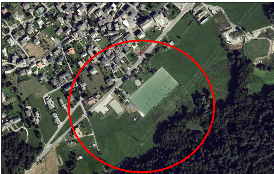
ORTOFOTO REGIONE LOMBARDIA