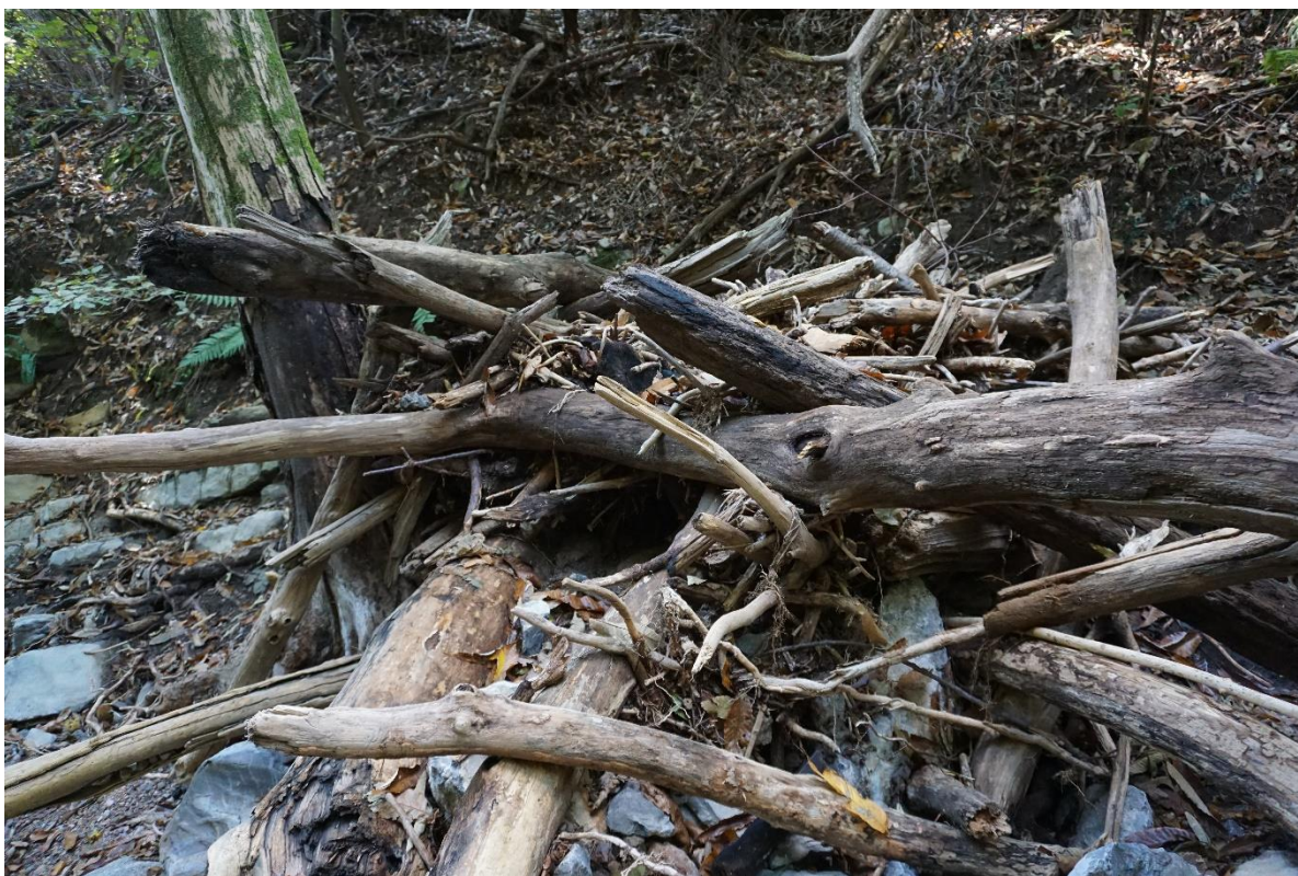
Figura 1: alveo del torrente Tinella

Di seguito un esempio dello stato in cui versa il territorio del Parco.