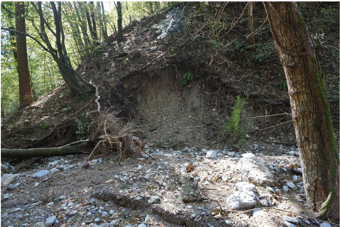
Figura 3: fenomeni di erosione nei pressi del torrente Tinella