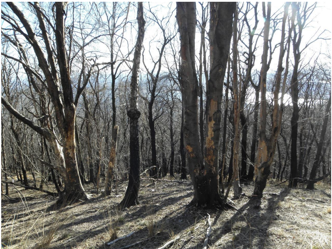
Figura 2: effetti degli incendi. Sullo sfondo il Lago di Varese