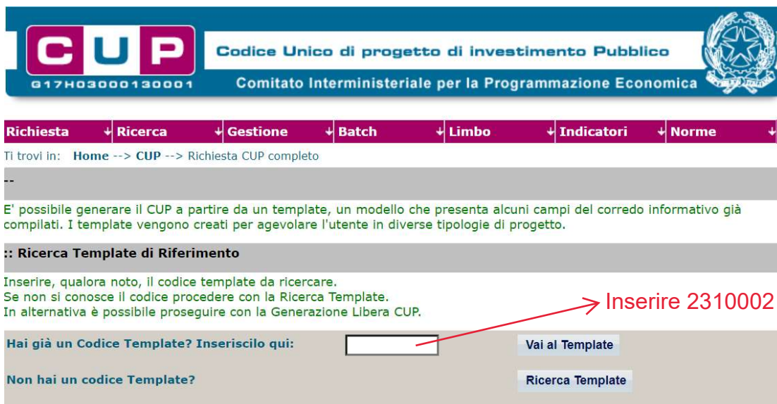
Fig. 1 – Inserimento del Codice Template

STEP 3. Seguire la procedura di generazione guidata compilando le schermate nell'ordine previsto.