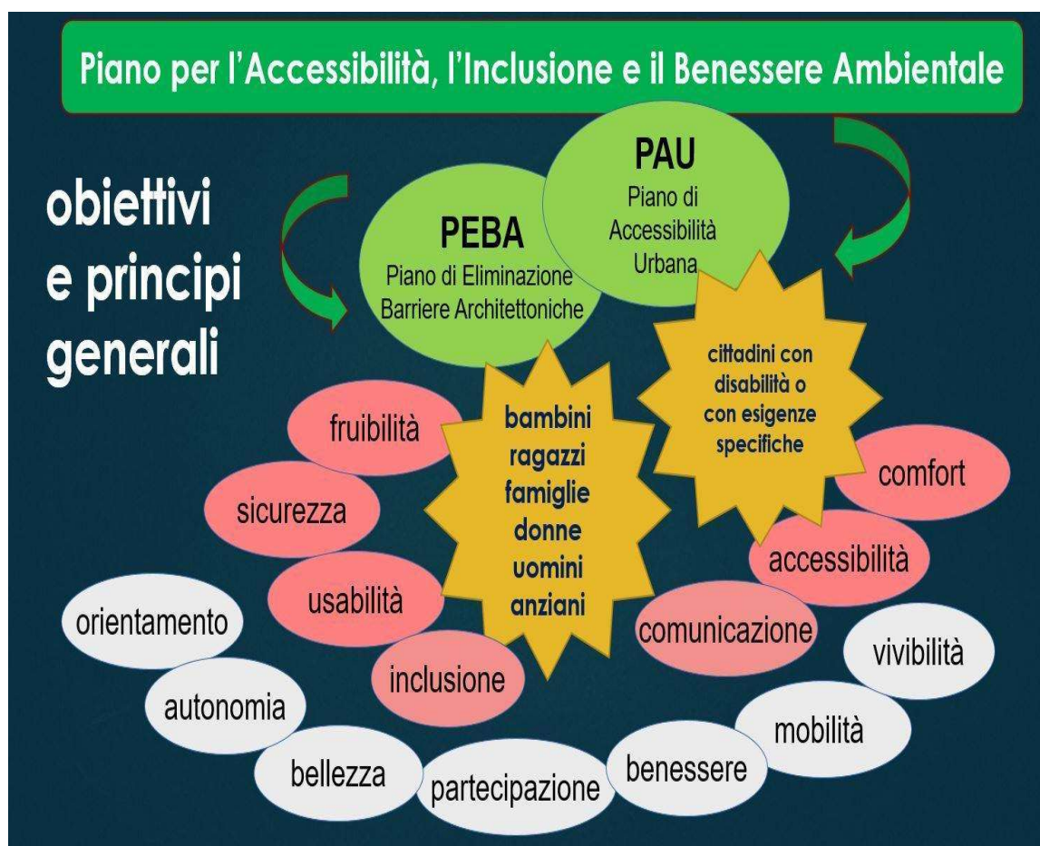
Fig. 1 – Obiettivi e principi