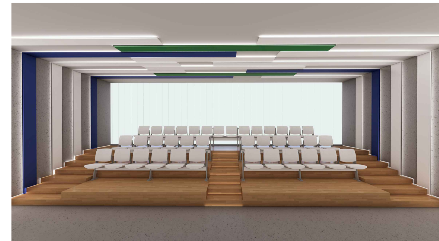
Rendering sala conferenze