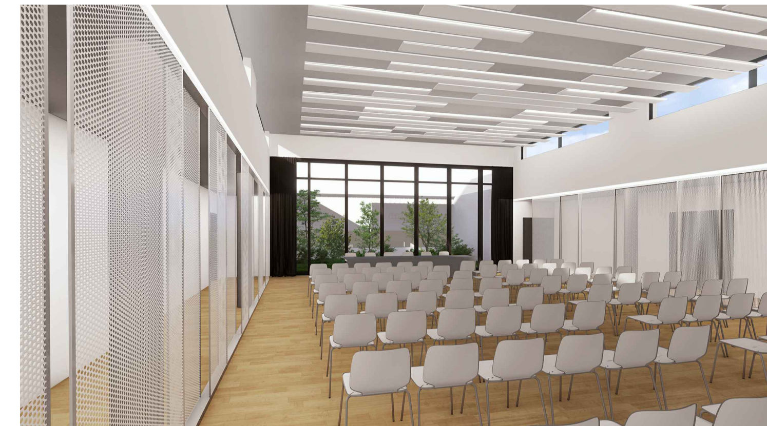
Rendering sala polifunzionale

TOTALE SUPERFICI IN GESTIONE A BCC: SU + SA Piano terra = mq 52.60 SU + SA Piano primo = mq 491.66 Terrazze verdi = mq 90.94 TOTALE SUPERFICI = mq 635.20