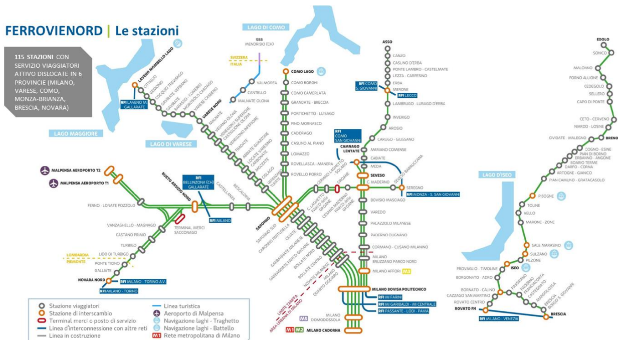
Figura 1 - I rami della rete infrastrutturale di FERROVIENORD S.p.A.