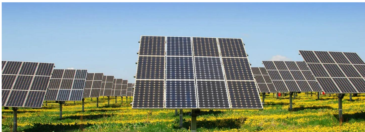
Figura 2 - caso d)

Per gli impianti di tipologia F 1.5. nel § 2 sono state individuate le seguenti tipologie: